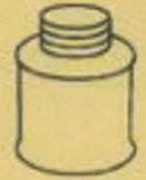
CPVC solvent cement