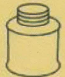
سی پی وی سی سیمنٹ کا محلول